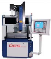
SL 74 Öl