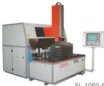
SL 1060-6 CNC