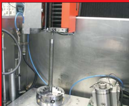
Aufspannsituation: Da die Durchgangssituation für derart große Teile nicht ausreicht, ist dieses in den Maschinentisch eingelassen, sodass nur der obere Teil zu sehen ist.

Mit der Maschine werden zukünftig Grundlagen in der funkenerosiven Bohrbearbeitung erarbeitet, die einen immer größer werdenden Stellenwert in der Fertigungstechnik von modernen Werkstoffen, hauptsächlich in der Medizintechnik aber auch in der Luft- und Raumfahrttechnik, besitzt. Aber auch sehr praxisorientierte Arbeiten werden von den wissenschaftlichen Mitarbeitern am IMP mit dieser Maschine bearbeitet. Sei es die Technologieentwicklung für neue Dielektrika oder die Überwachung des Bohrprozesses.