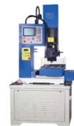
SL 32-3 CNC